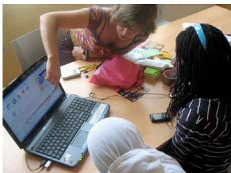
Se pasa a visualizar las pistas en el ordenador.