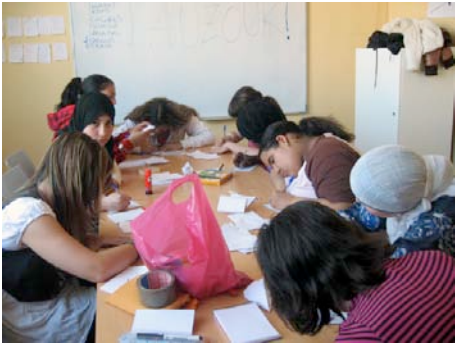
Trabajando en las presentaciones personales.