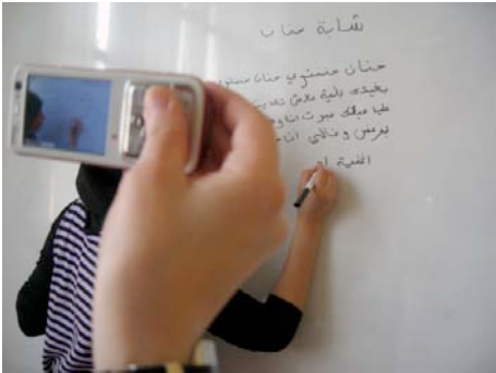
Trabajo de captura de materiales en el taller.

Los objetivos generales de CASI TENGO 18 son: