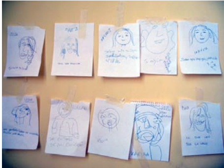
Retratos de l*s participantes en la pared.