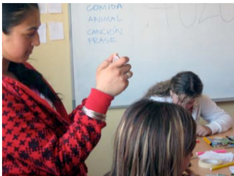
Nazaret capturando sus primeras imágenes.

La programación de actividades es muy intensa. Es interesante estudiar la posibilidad de dedicarle más sesiones de trabajo.