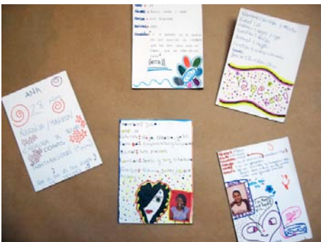
Catetos personales de algunas participantes.