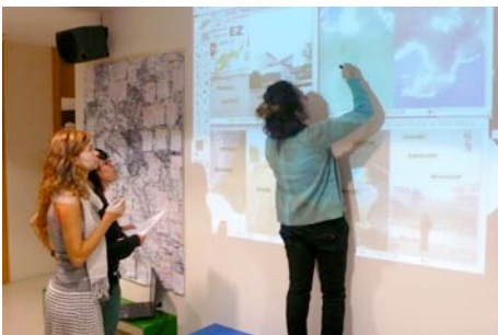
Dando forma y contenido al fanzine (Museo BBAA).

http://www.casitengo18.com/es/proyectos/derivefanzina_1/derivefanzina_02.html