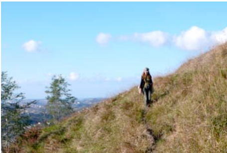
Panorámica de todo el territorio (Enekuri- Artxanda).

Una primera sesión de dos horas en el municipio de Getxo de contacto con el grupo facilitando algunas de las claves para el transcurso de la actividad.