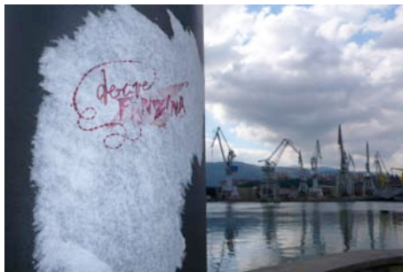
La huella del taller en puntos del recorrido (Axpe).

Deriva es un concepto principalmente propuesto por la Internacional Situacionista. En francés la palabra dérive significa tomar una caminata sin objetivo específico, usualmente en una ciudad, que sigue la voluntad del momento.