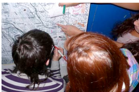
Primeras identificaciones con el territorio de análisis.