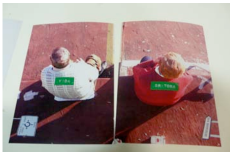
“Vida-Gritona”, doble página en construcción.