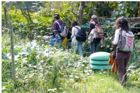
Una zona de huertas inesperada (Getxo).

inquietudes, socializar sus sueños y preocupaciones y poner en colectivo sus opiniones. Siempre de manera libre y en sus propias claves.