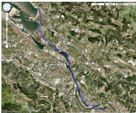
Recorrido entre Getxo - Museo BBAA.(Google-map).

Situaciones urbanísticas muy diferentes, zonas privilegiadas y zonas deterioradas juntas, realidades culturales muy diversas que se entremezclan... Todo en un territorio relativamente pequeño. Y la sensación constante de estar re-descubriendo, re-encontrado o re-conociendo los lugares. Tal vez porque "siempre que he pasado por aquí nunca me he fijado o me he parado a mirar con calma".