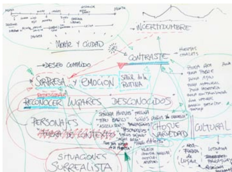
Esquema de ideas con experiencias de la deriva.