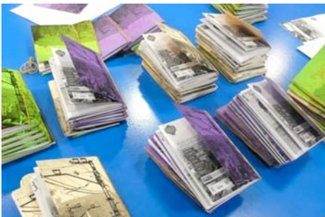
Fanzines agrupados para su próxima distribución.