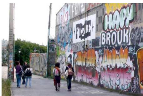
Tramo junto a las vías del metro (Astrabudua).

A lo largo de la actividad se realizarán acciones que combinen la reflexión y la expresión, no sólo plástica (expresiva) sino analítica (introspectiva), con las que busquen, se expresen y reflexionen sobre temas de su interés.