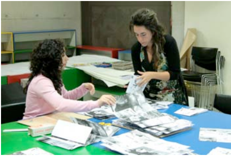
Momento de la producción de 150 ejemplares.