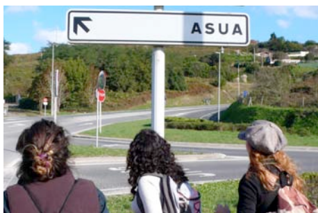
Un momento de toma de decisión (Enekuri).

Una sensación constante de estar re-descubriendo, re-encontrado o re-conociendo los lugares. Tal vez porque “siempre que he pasado por aquí nunca me he fijado o me he parado a mirar con calma”.