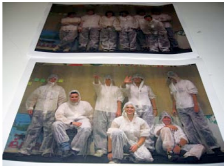
Taldea eraldatuz doa.