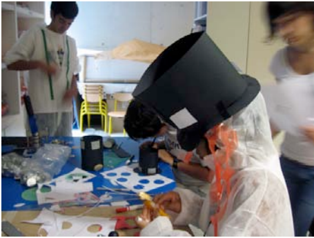
Janire bere pertsonaia lantzen.

mahaiak dituen lan-eremua eta gainera, hormaren bat saioan zehar landutako ideien edo irudien eta taldearen argazki-irudien euskarri gisa erabiltzeko aukera ere izango dugu.