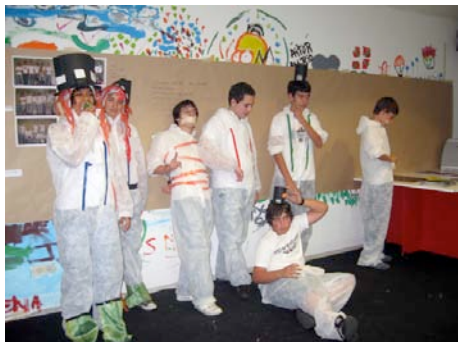
Taldea azken argazkia ateratzeko prestatzen.

http://www.intersticios.es/article/viewFile/2346/1896