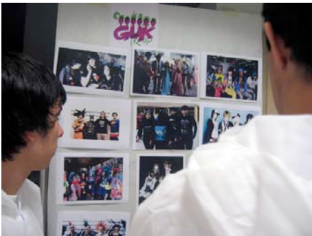
Eta ni... zer izango naiz?

Nola aztertu eta eraikiko dugu taldearen identitatea edo nortasuna?