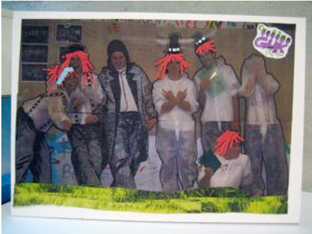
Partaide guztien artean sortutako behin betiko tribua.