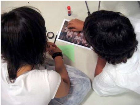
Irati eta Eder euren tribuari buruzko collage-a prestatzen