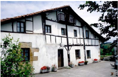
20. galderaren erantzuna.

Aldizkariko kolaborazioa eta bere izaera irakurleei zuzendutako denbora-pasa gisa definitu zen. Irakurleak argitaratutako irudiak lau galderekin lotu behar zituen. Irudi hauek lantegiko saioetan erakusleen artean gehien errepikatu ziren erantzunak izan ziren.