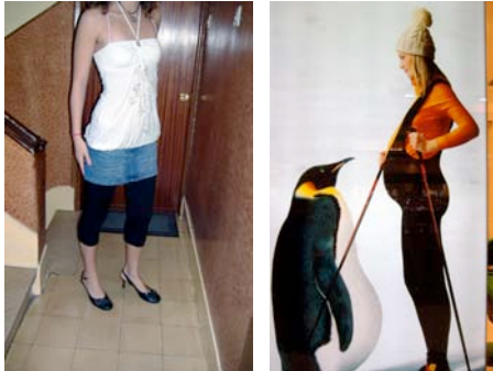
11 eta 18. galderen erantzunak.

Gazte bakoitzak paregabe eta ulertua sentitu behar du, baina era berean, talde bateko partaide, gustu, dinamika eta aurreiritzi berdinekin. Ez dute isolaturik egon nahi.