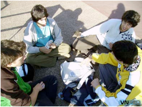
7. galderaren erantzuna.

Aldizkariko kolaborazioa eta bere izaera irakurleei zuzendutako denbora-pasa gisa definitu zen. Irakurleak argitaratutako irudiak lau galderekin lotu behar zituen. Irudi hauek lantegiko saioetan erakusleen artean gehien errepikatu ziren erantzunak izan ziren.