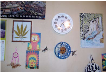
1. galderaren erantzuna.

Haien gustukuak ez diren gauzekiko eta arbuiatzen dituzten taldeetako partaideekiko distantzia jartzeko beharra dute.