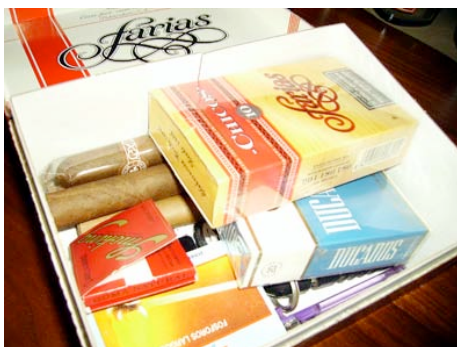
14. galderaren erantzuna.

Logela baten irudia, parte-hartzaileen artean atera den erantzun ohikoena.