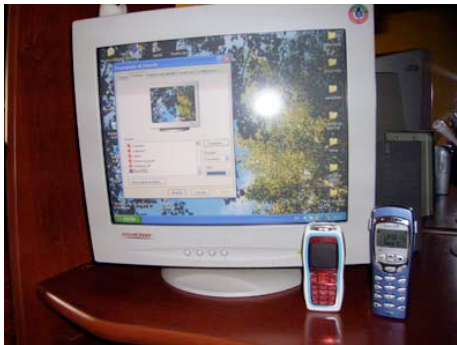
15. galderaren erantzuna.