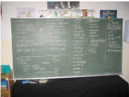
Brainstorming-a Experiencia Naranja 07-ariburuz.

Honela azalduko genuke KaraokEX: “Ez uste bakarrik egin ahal izango duzunik. Helburuak ezarri, lantaldea bildu eta EN’07-ko parte-hartzaile guztiek zuen kantua abestea eta dantzatzea lortuko duzue. Erronka parte hartzailea da eta dantza laranja denen oinetan egon dadin, besteen laguntza baliatzea da (eta besteek zurea, jakina) garrantzitsuenak”.