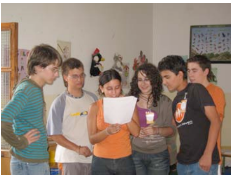
Karaokerako probak egiten.

KaraokEX herriko eskolan egin zen eta lantegi guztietan landutakoa “Sede Social Municipal” delakoan erakutsi zen.